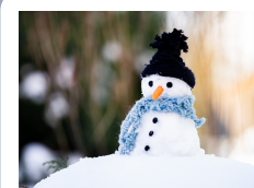
MUÑECO DE NIEVE